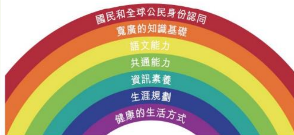
圖表 2.3 中學教育更新的七個學習宗旨